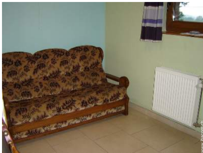
Schrankbett(en) 2 Personen