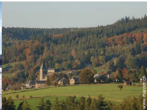
Blick auf Wald