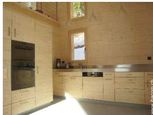
große amerikanische Küche