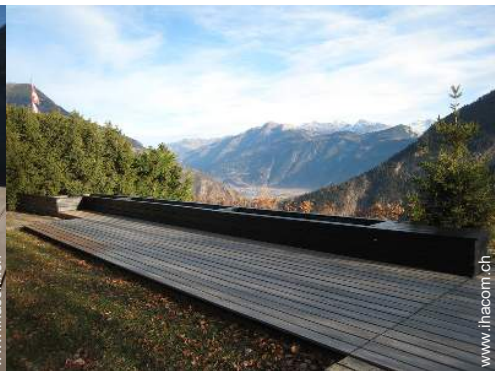
Park und Garten