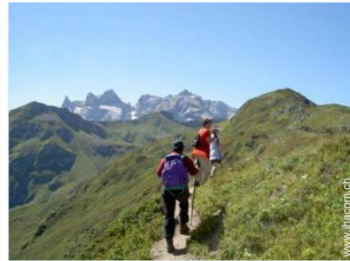
Gebirgsaktivitäten in der Nähe