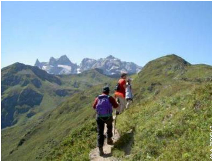
Gebirgsaktivitäten in der Nähe