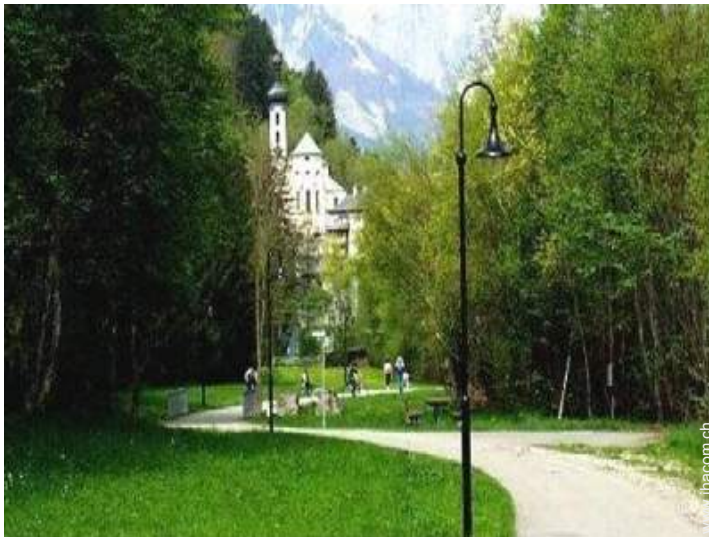
Attraktionen und Entspannung