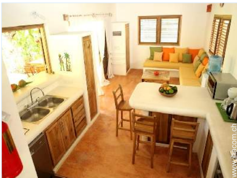
große amerikanische Küche