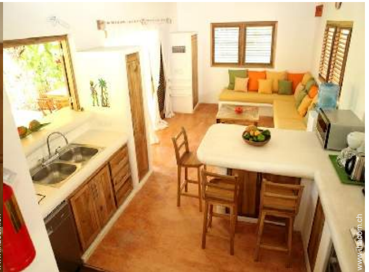
große amerikanische Küche