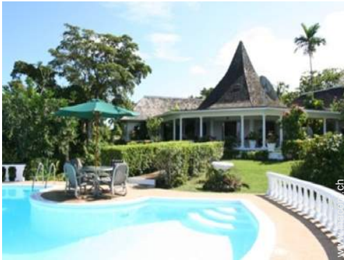
Villa mit Charme