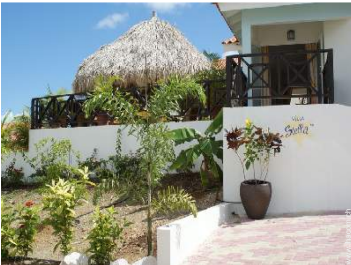
Äußerer Rahmen zur Verfügung der Gäste