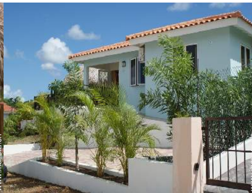
Villa mit Charme