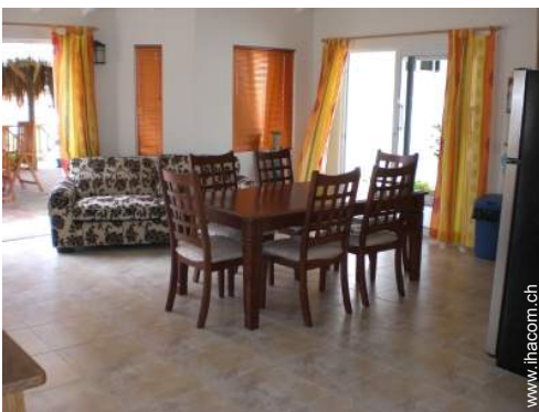
Raumaufteilung und Annehmlichkeiten