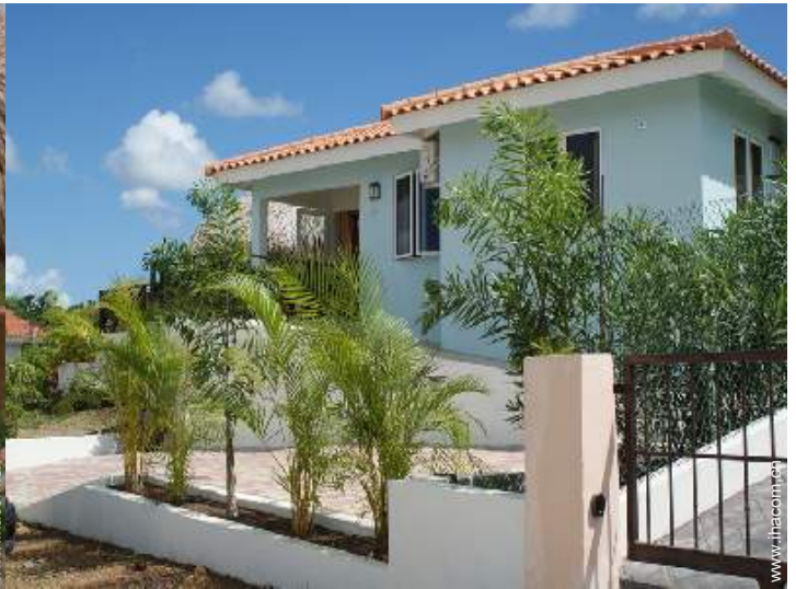
Villa mit Charme