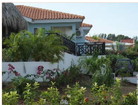
Äußerer Rahmen zur Verfügung der Gäste