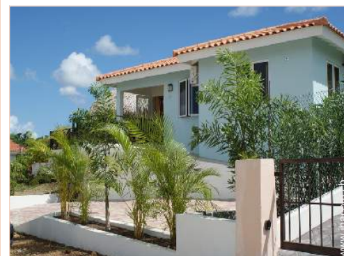
Villa mit Charme