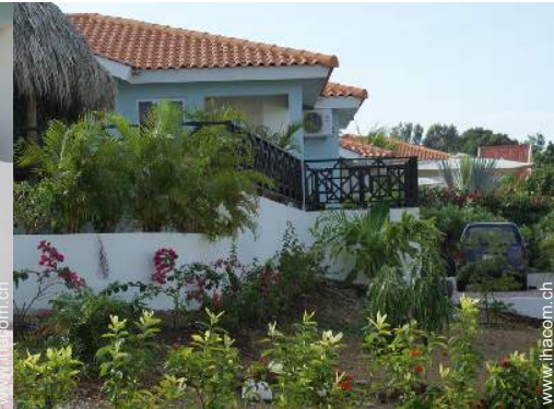
Äußerer Rahmen zur Verfügung der Gäste