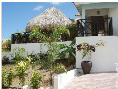
Äußerer Rahmen zur Verfügung der Gäste