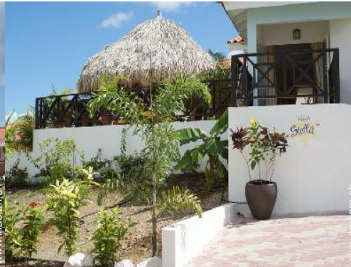
Äußerer Rahmen zur Verfügung der Gäste