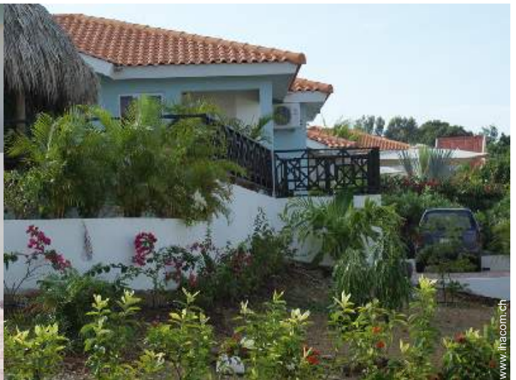
Äußerer Rahmen zur Verfügung der Gäste