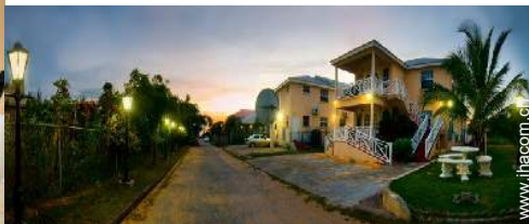
Blick auf Straße/Avenue