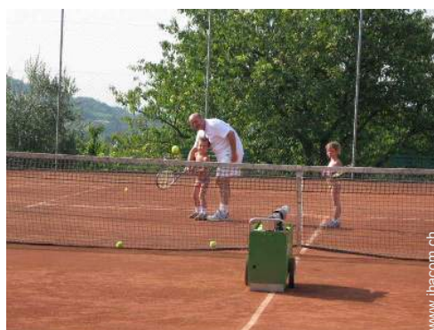
Tennis - Erde