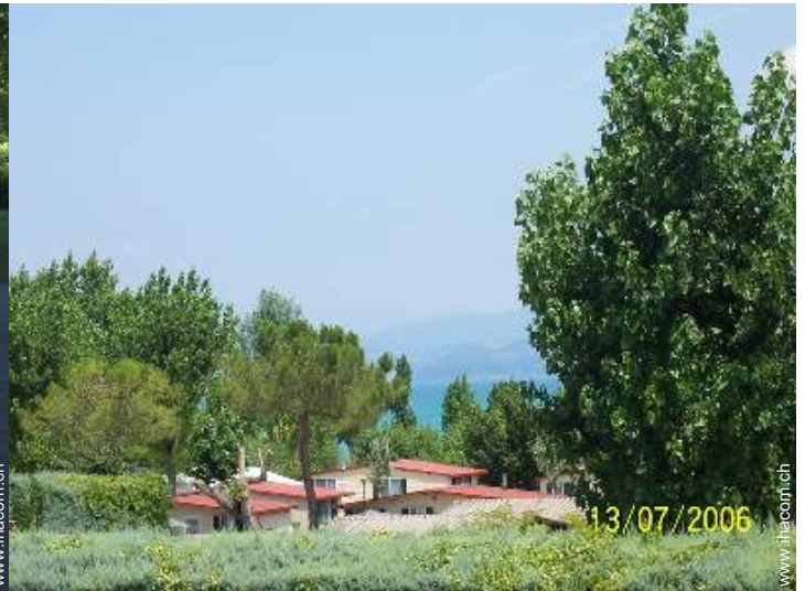
Blick auf See