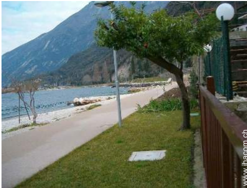
direkter Zugang zum Strand