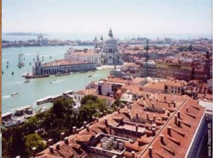
Blick auf Stadt