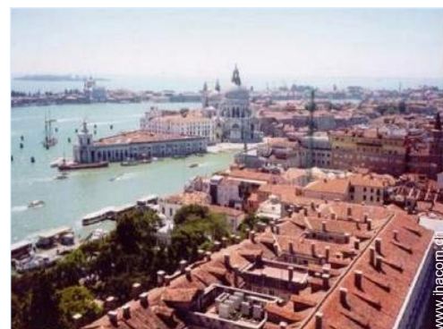
Blick auf Stadt