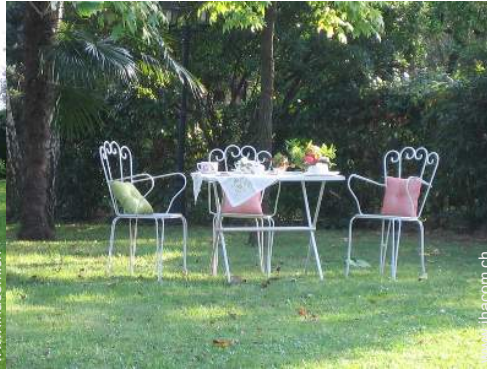
Blick auf Wiese