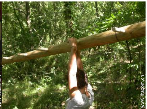
Sommeraktivitäten in der Nähe