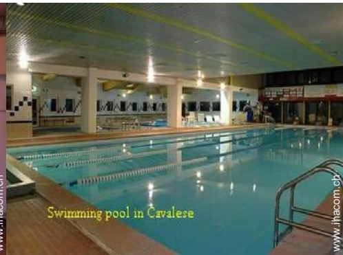
Swimming pool in Cavalese