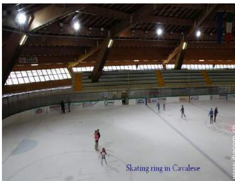
Skating ring in Cavalese