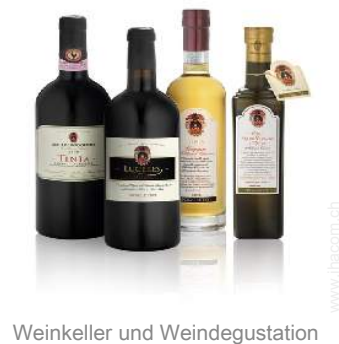
Weinkeller und Weingustation