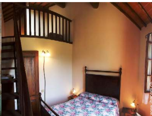
Raumaufteilung zur Verfügung der Gäste