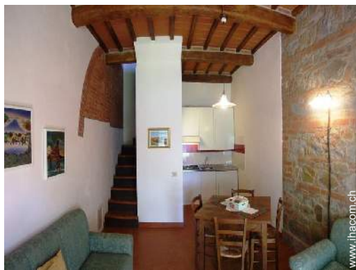
Raumaufteilung zur Verfügung der Gäste