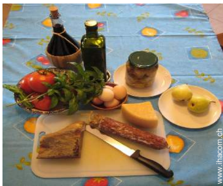
Weinkeller und Weindegustation