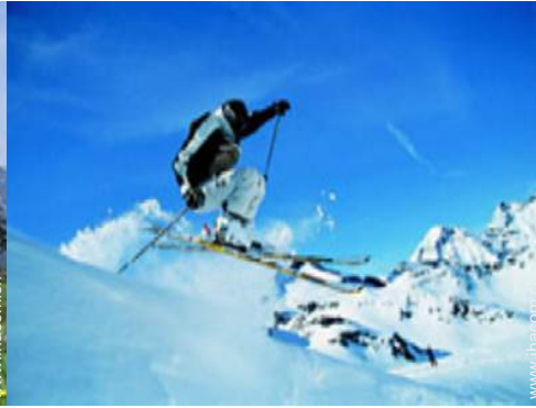
Winteraktivitäten in der Nähe