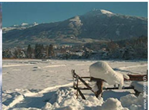
Winteraktivitäten in der Nähe