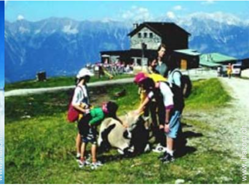
Sommeraktivitäten in der Nähe