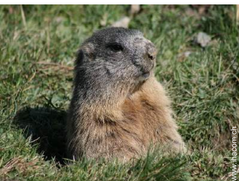
Gebirgsaktivitäten in der Nähe