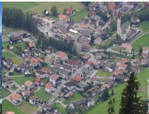
Blick auf Dorfzentrum