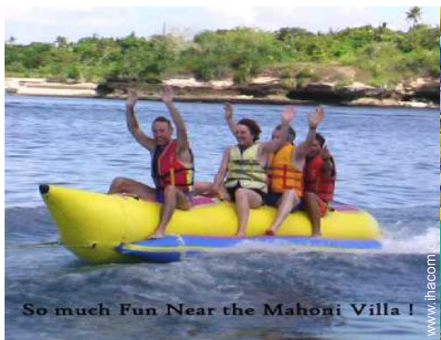
So much Fun Near the Mahoni Villa !