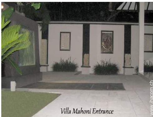
Villa Mahoni Entrance