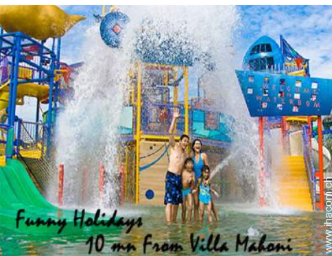
Funny Holidays 10 mn from Villa Mahoni