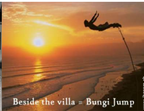
Beside the villa = Bungi Jump