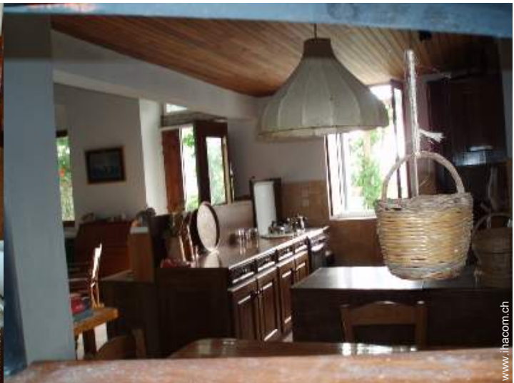
große amerikanische Küche