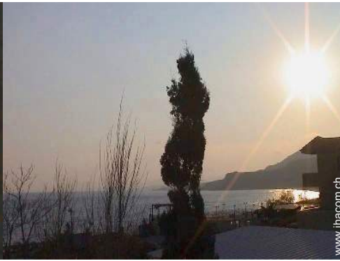
Blick auf Sonnenuntergang