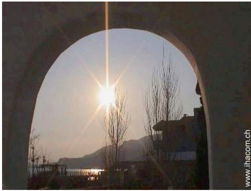
Blick auf Sonnenuntergang