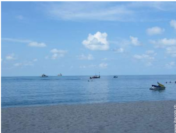
In der Nähe