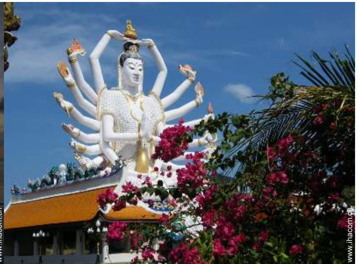
In der Nähe