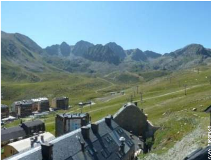
Blick auf Gebirge