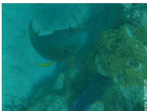
Vor Ort anwesend