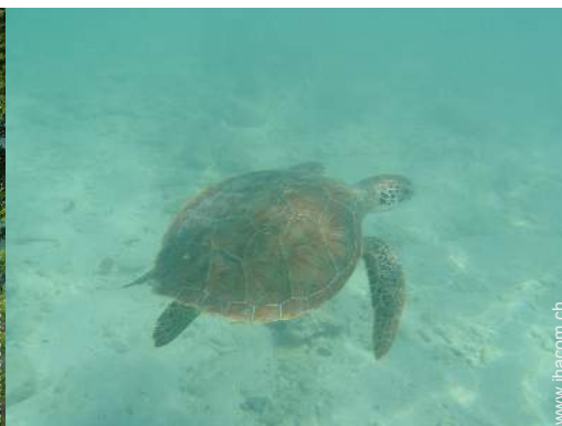
Vor Ort anwesend