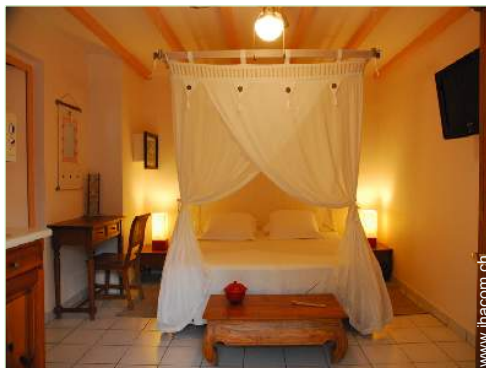
Stuidowohnung mit Charme

Whirlpool, Klavier, Schnorchelausrüstung (en)