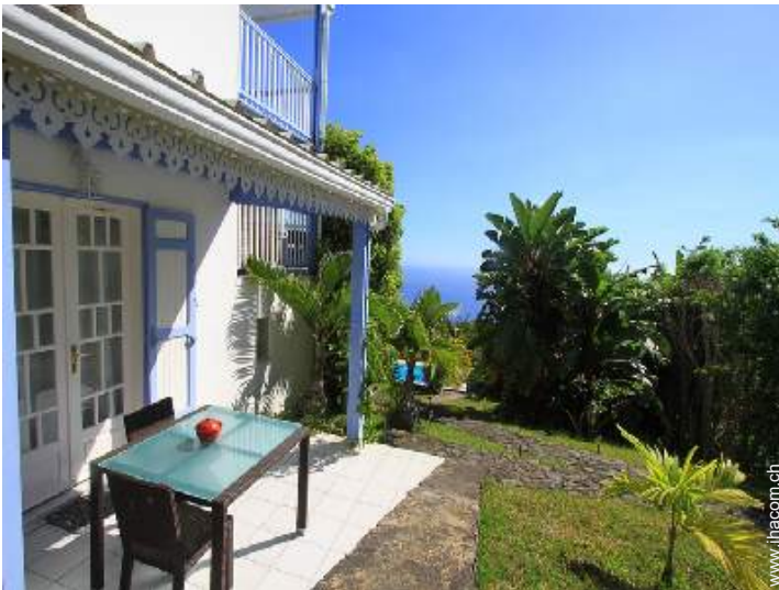
Studiowohnung mit Charme