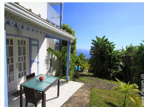
Stuidowohnung mit Charme