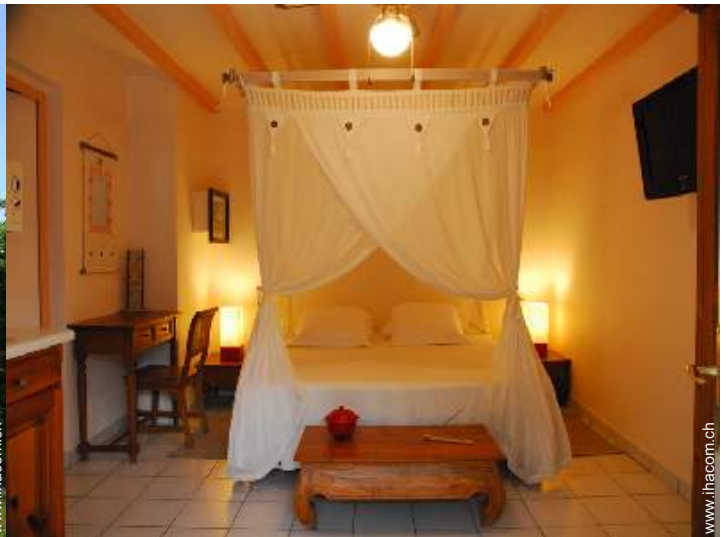
Studiowohnung mit Charme