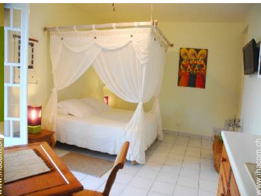
Studiowohnung mit Charme