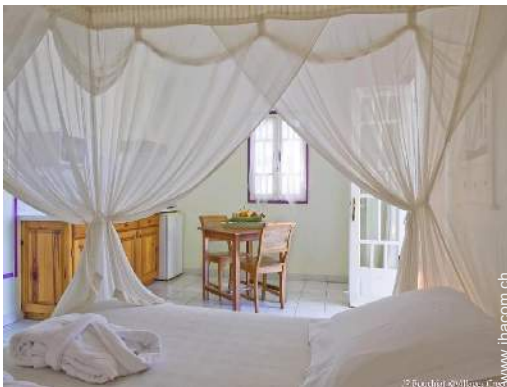
Studiowohnung mit Charme