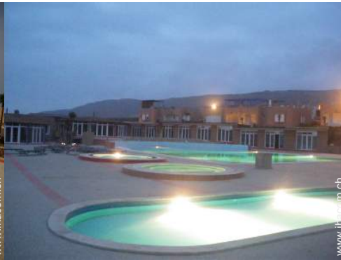
Swimmingpool in Wohnanlage