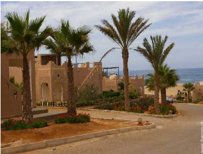
direkter Zugang zum Strand