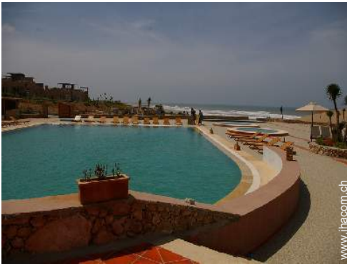
Swimmingpool in Wohnanlage