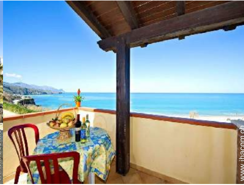
Ausblick überdachte Terrasse