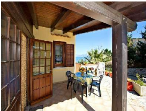
Ausblick überdachte Terrasse