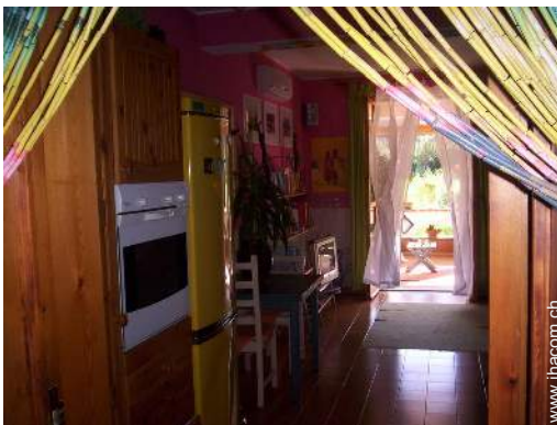
Raumaufteilung und Annehmlichkeiten