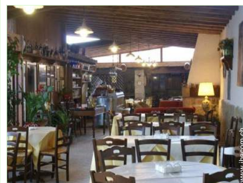
Raumaufteilung zur Verfügung der Gäste

- Stadtzentrum 3km - Bushaltestelle 3km - Straßenbahn 3km - Fahrrad-/Mountainbikeverleih <50m - Bäckerei 3km - Ortliche Geschäfte 3km - Supermarkt 3km - Internetcafé <50m - Post 3km - Bank 3km - Apotheke 3km - Arzt 3km - Krankenschwester 3km - Krankenhaus 3km - Ambulanz 3km