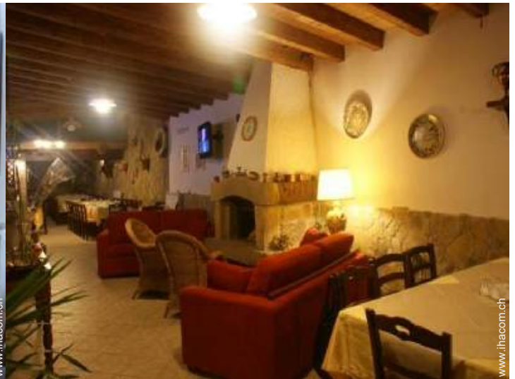
Innenkomfort zur Verfügung der Gäste