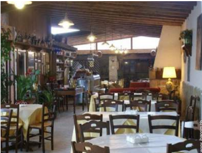
Raumaufteilung zur Verfügung der Gäste