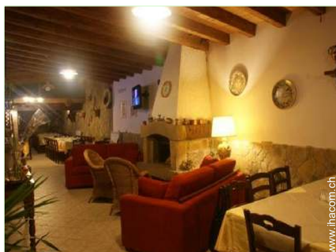
Innenkomfort zur Verfügung der Gäste

Tischtennis, Tischtennisschläger, Bouleplatz, Boulespiel(e), 6 Fahrrad/-räder, Pferde und Reitausrüstung