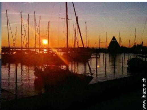
Blick auf Hafen