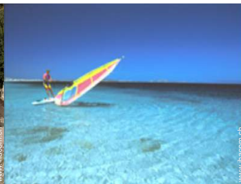
Wassersport in der Nähe