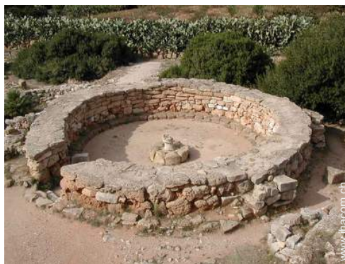
Attraktionen und Entspannung