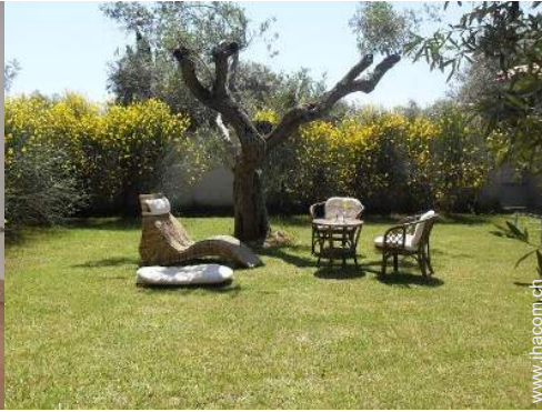
Blick auf Wiese