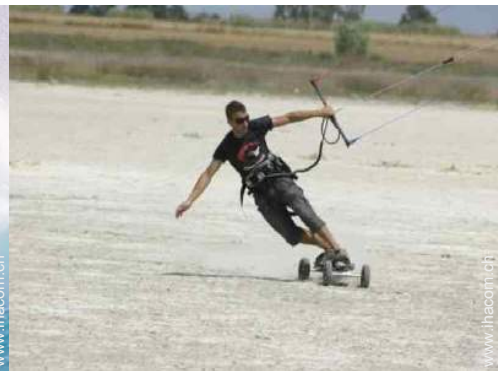
Flugsport in der Nähe