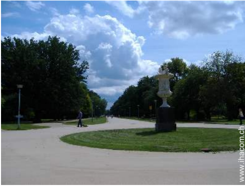
Park und Garten