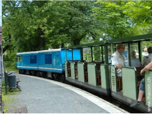
Park und Garten