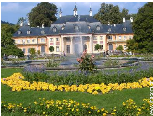
Park und Garten