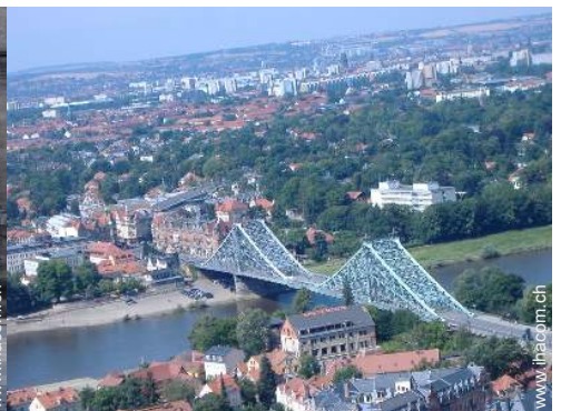
Attraktionen und Entspannung