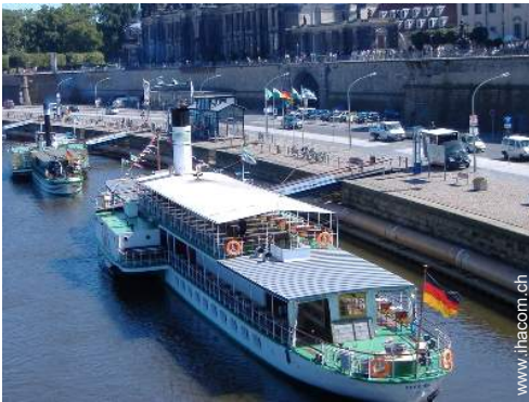
Sommeraktivitäten in der Nähe