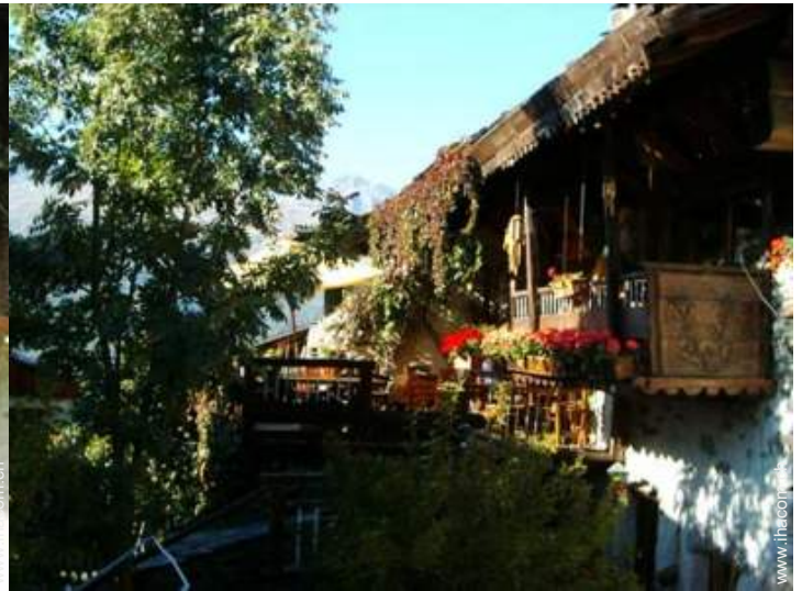
Holzchalet mit Charme