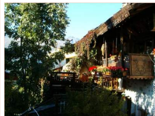
Holzchalet mit Charme