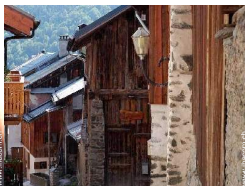
ehem. Scheune mit Charme