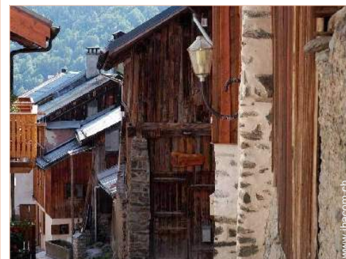
ehem. Scheune mit Charme