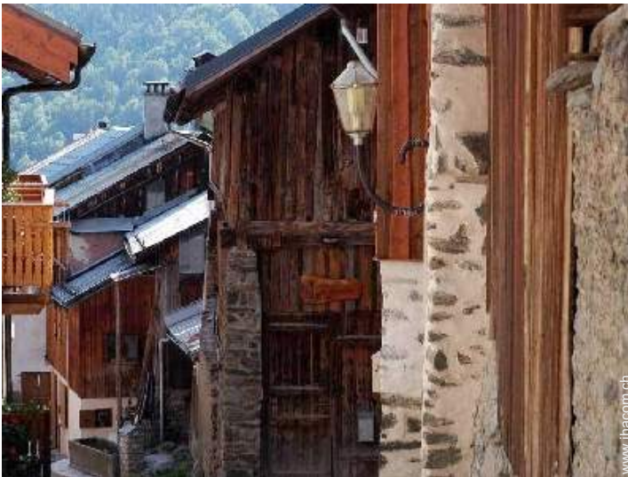
ehem. Scheune mit Charme