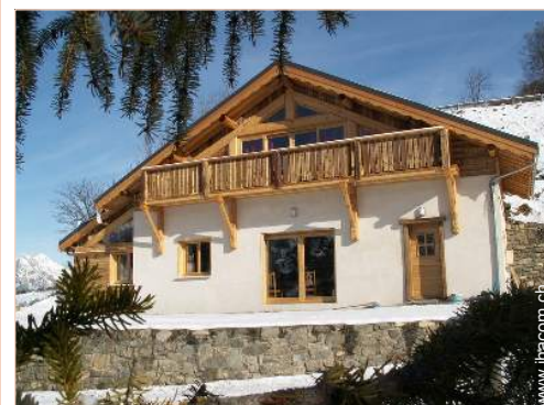
Bergchalet mit Charme