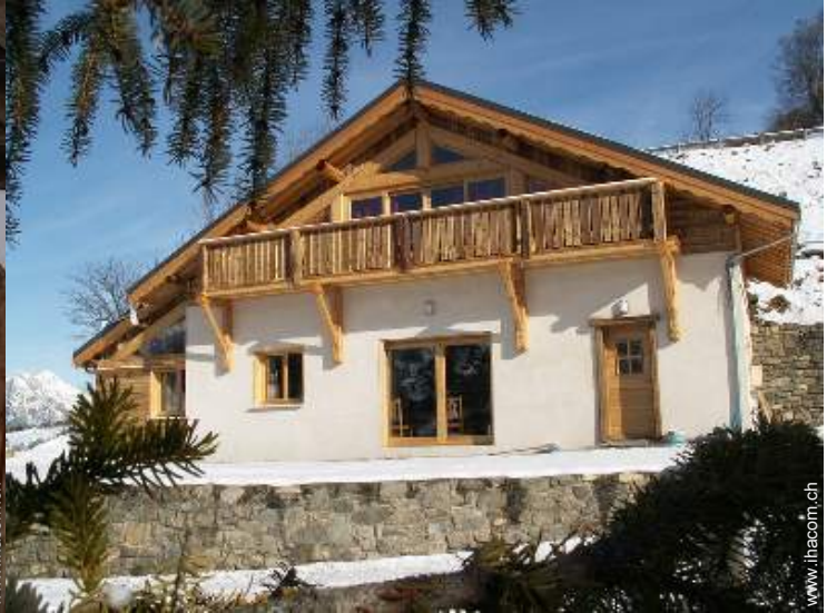
Bergchalet mit Charme