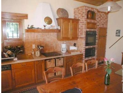
große separate Küche