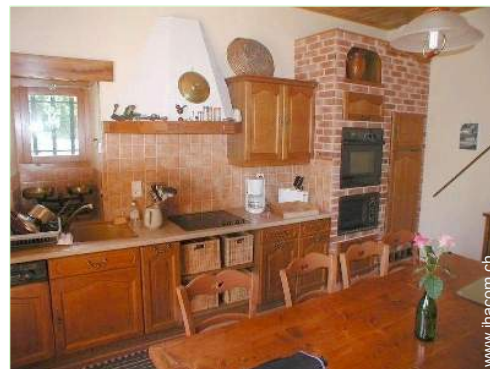
große separate Küche