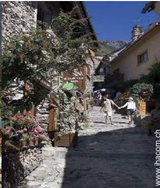
Blick auf Dorfzentrum