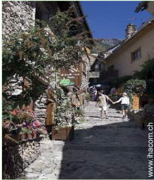
Blick auf Dorfzentrum