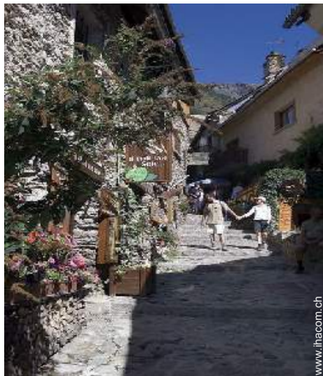
Blick auf Dorfzentrum