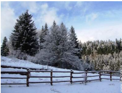
Blick auf Wald