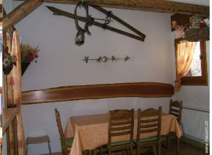
Duplex mit Charme