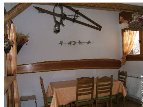
Duplex mit Charme