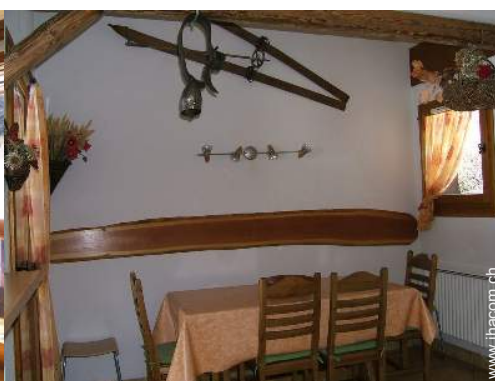
Duplex mit Charme