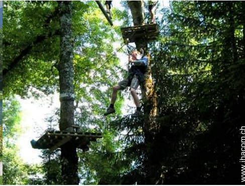
Sommeraktivitäten in der Nähe