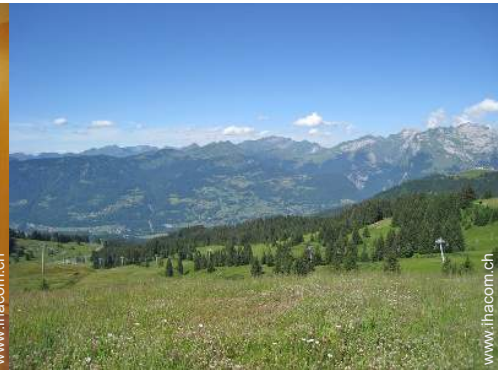
Blick auf Gebirge