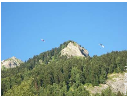
Flugsport in der Nähe