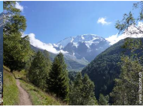
Blick auf Gebirge