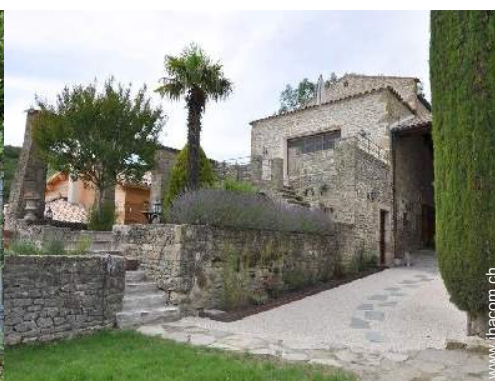
exklusives provenzalisches Haus