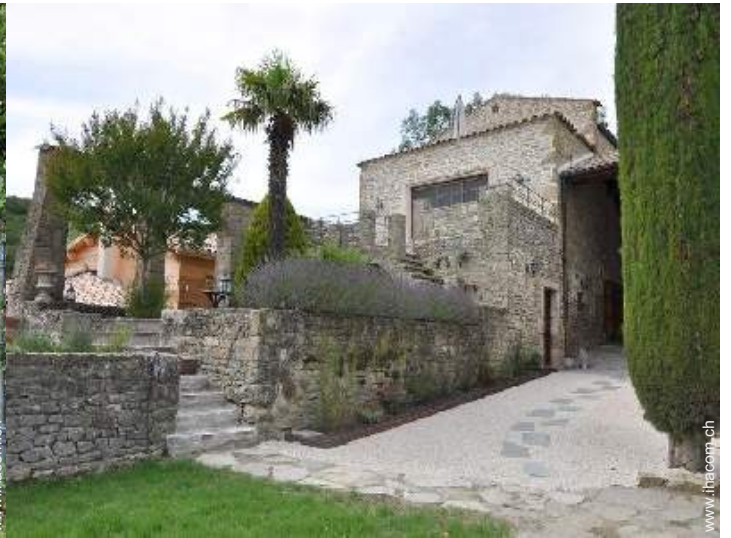
exklusives provenzalisches Haus