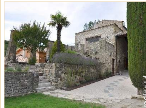
exklusives provenzalisches Haus