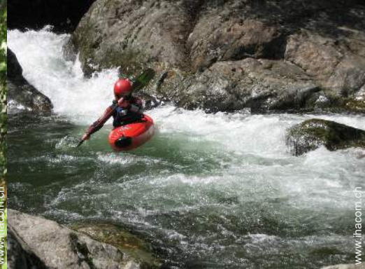
Blick auf Fluss