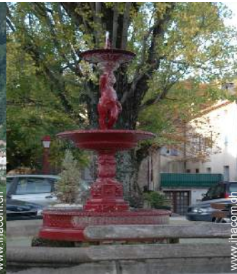
Freizeitaktivitäten in der Nähe