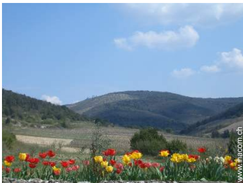
Blick auf Weinberge