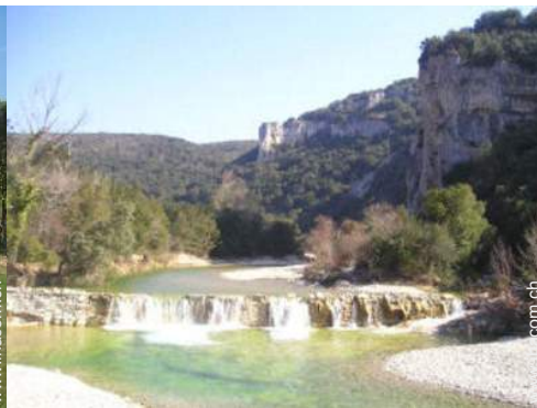
Blick auf Fluss