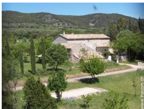
Bauernhaus mit Charme (Mas)