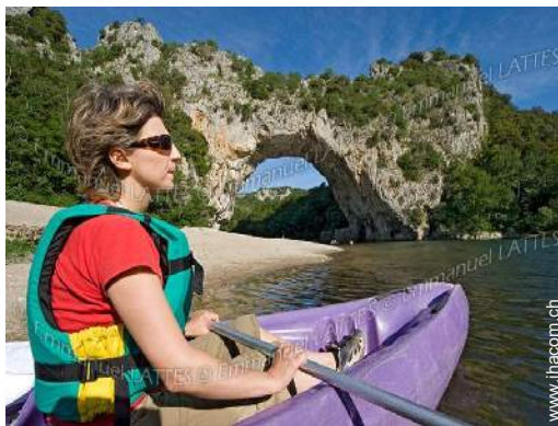
Wassersport in der Nähe