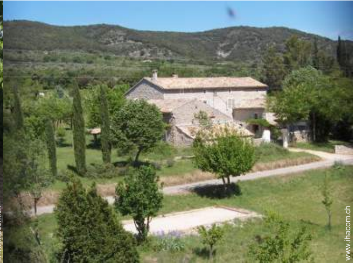
Bauernhaus mit Charme (Mas)