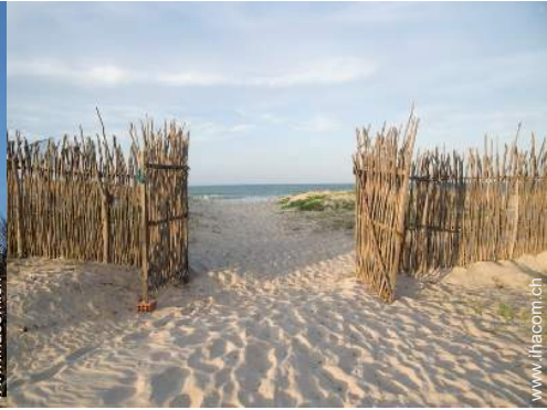
direkter Zugang zum Strand