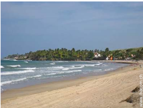
Blick auf Ozean