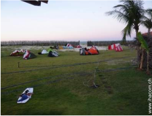
direkter Zugang zum Strand