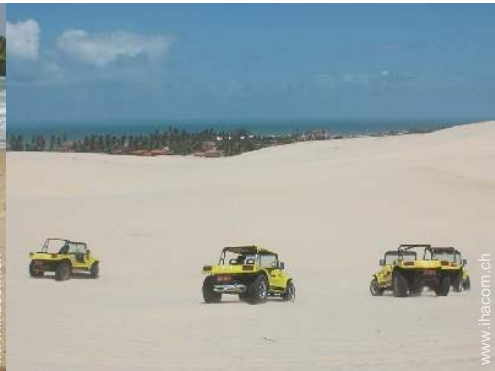
Freizeitaktivitäten in der Nähe