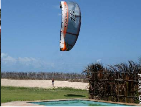
direkter Zugang zum Strand