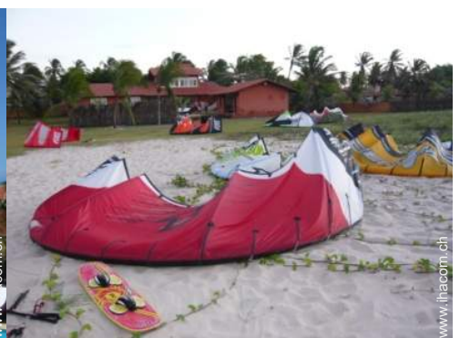
direkter Zugang zum Strand