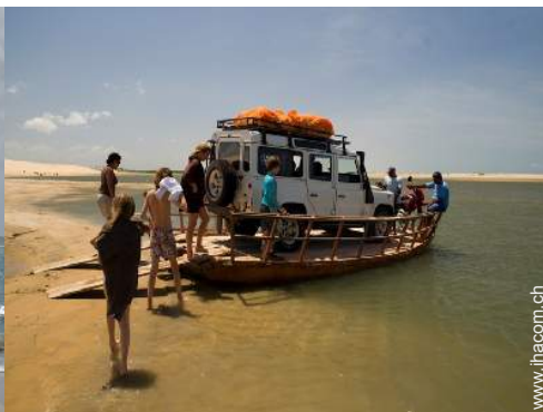
Freizeitaktivitäten in der Nähe