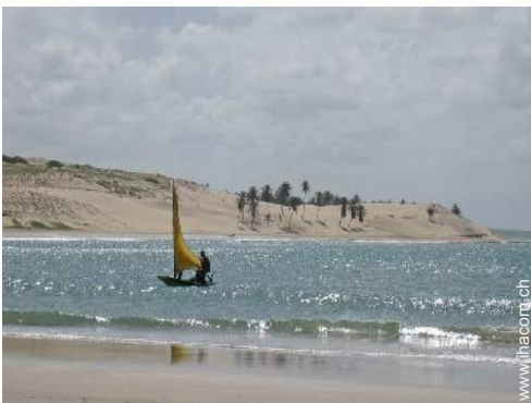
Freizeitaktivitäten in der Nähe